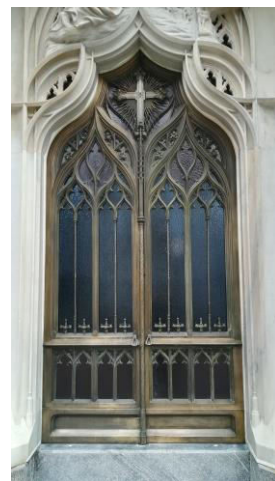
Edicola cimiteriale restauro lapideo, restauro di superfici in lega (ottone)